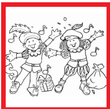
twee pieten bij een huis