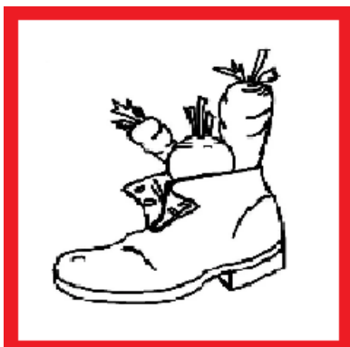
een gevulde schoen