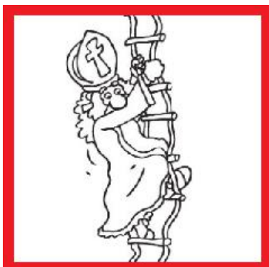
sint op de bovenverdieping