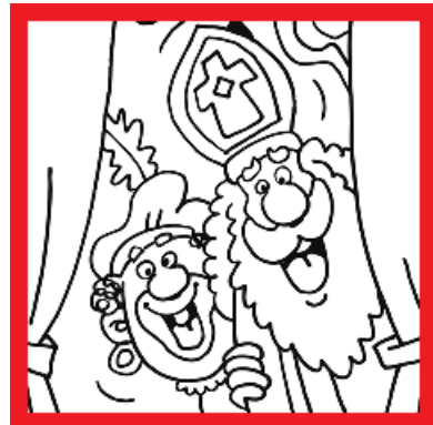
Sinterklaas en Piet samen