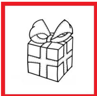
1 los cadeautje