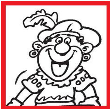
een lachend pietje

Per huis mag je 1 plaatje aanstrepen, als je bij dat huis ziet wat er op het plaatje staat afgebeeld.