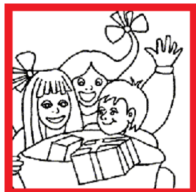
kind(eren) achter het raam